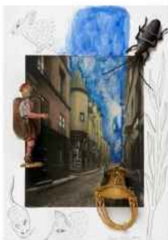
Ilustración de Carmen Calvo para la ópera "El oro del Rey".

Archivado en: Teatro Loco · Artes · Ópera · Sala conciertos · Teatro musical · Cataluña · Libro · España · Música · Artes escénicas · Cultura