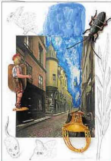
Una obra rica en signos. Carmen Calvo recrea en sus collages un mundo inquietante y perturbador en el que los objetos se convierten en fetiches y cada imagen acaba siendo un signo. La artista valenciana ha realizado 50 obras para ilustrar la temporada del Liceu. De arriba abajo, su visión de 'L'elisir d'amore', 'Madama Butterfly' y 'El oro del Rin'.